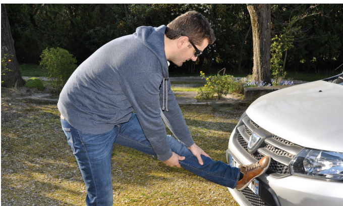
Pour le dos et les lombaires.

⇒ Position debout, la paume des mains à plat sur l'arrière du crâne. Baisser la tête en appuyant doucement pendant une dizaine de secondes avec les mains.