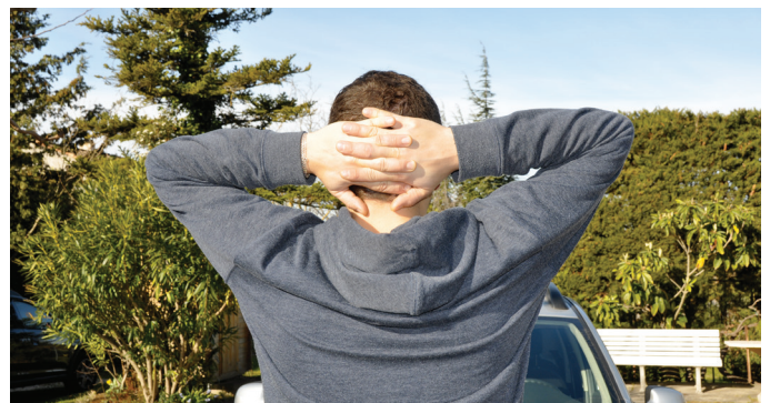
Pour les trapèzes.

⇒ Tendre le bras en avant à l'horizontal. «Casser» le poignet vers l'extérieur (10 secondes, 3 fois de suite sur chaque main).