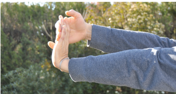
Contre les crampes dans les bras.

► Effectuer quelques exercices, comme ci-dessous :